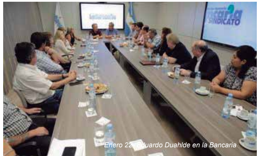
Enero 22- Eduardo Duhalde en la Bancaria