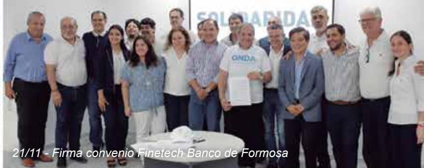
21/11 - Firma convenio Finetech Banco de Formosa