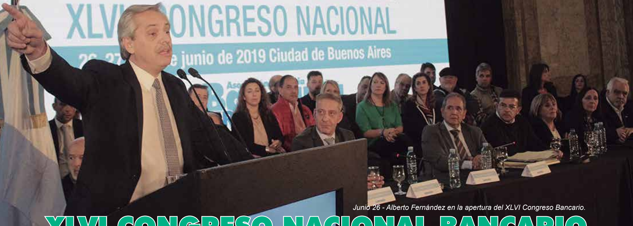
Junio 26 - Alberto Fernández en la apertura del XLVI Congreso Bancario.