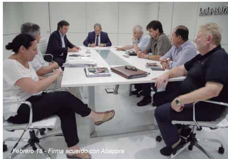
Febrero 18 - Firma acuerdo con Abappra

Febrero 13 - Insistimos junto a otras organizaciones sindicales en los re-