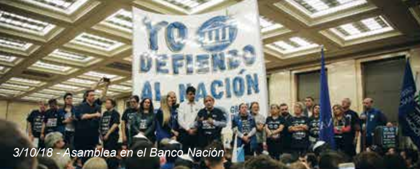
3/10/18 - Asamblea en el Banco Nación