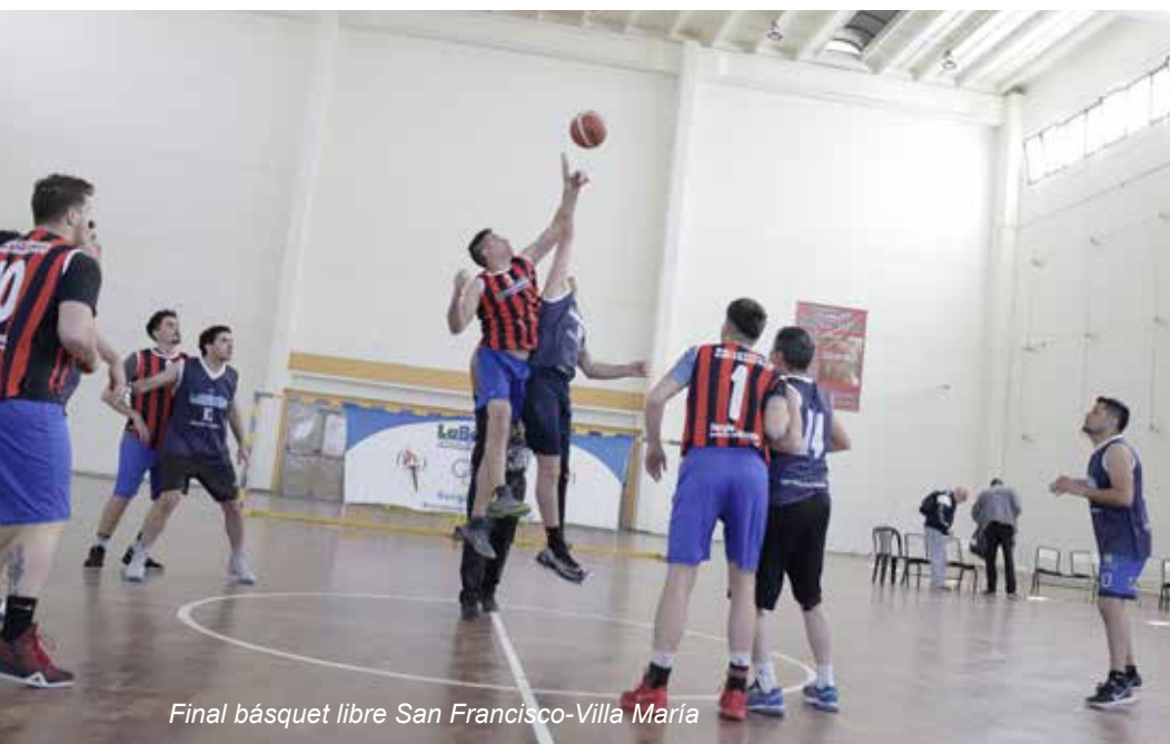
Final básquet libre San Francisco-Villa María

La continuación de este torneo se definirá en los próximos meses.