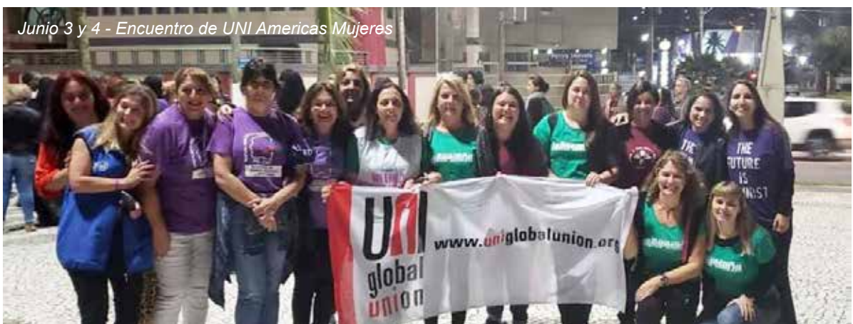
Junio 3 y 4 - Encuentro de UNI Américas Mujeres

Finalizan afirmando que la seguridad de los trabajadores y de toda la sociedad debe ser una prioridad, por ello apoyan a la Asociación Bancaria en los pasos que está dando para prevenir que se repitan estos hechos.