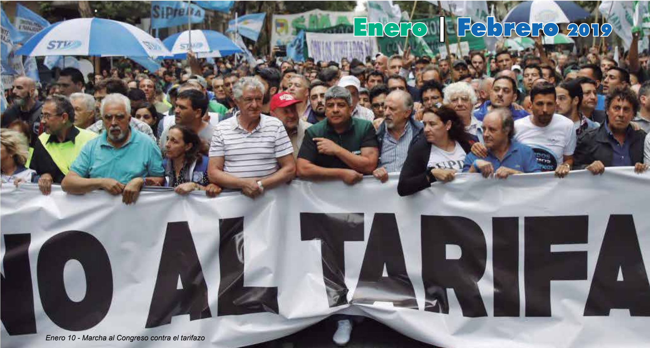
Enero 10 - Marcha al Congreso contra el tarifazo