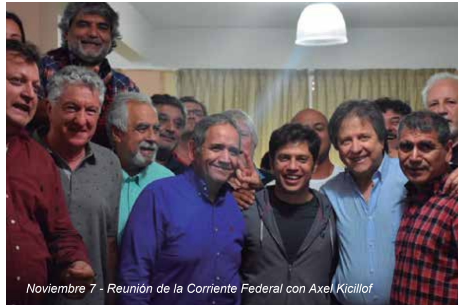
Noviembre 7 - Reunión de la Corriente Federal con Axel Kicillof

Noviembre 7 - La Corriente Federal de Trabajadores se reunió con el Gobernador electo de la Provincia de Buenos Aires, Axel Kicillof en la sede de la Federación Gráfica Bonaerense en la Av. Paseo Colón al 200.