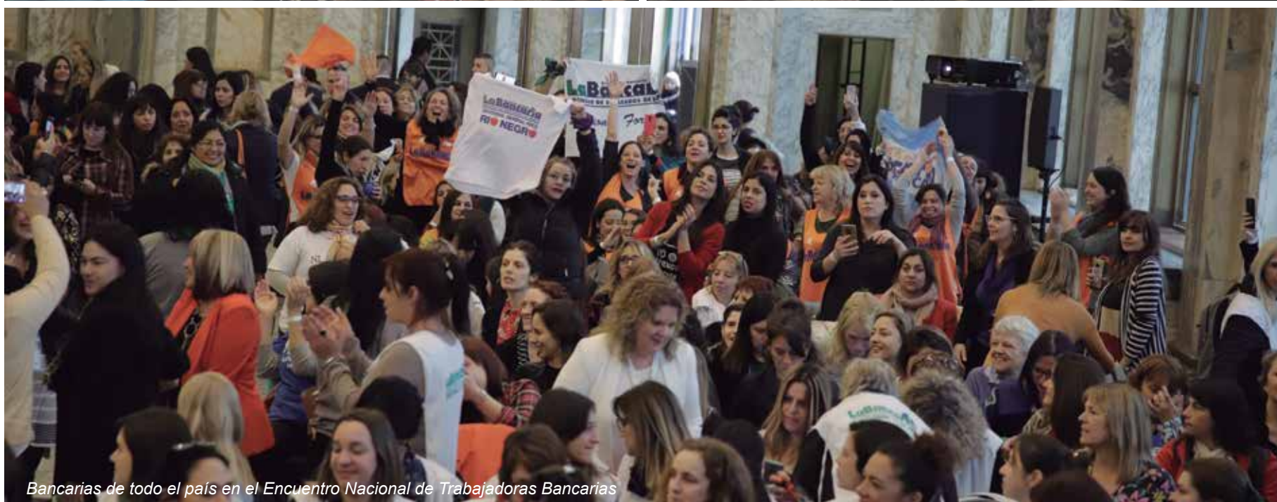
Bancarias de todo el país en el Encuentro Nacional de Trabajadoras Bancarias