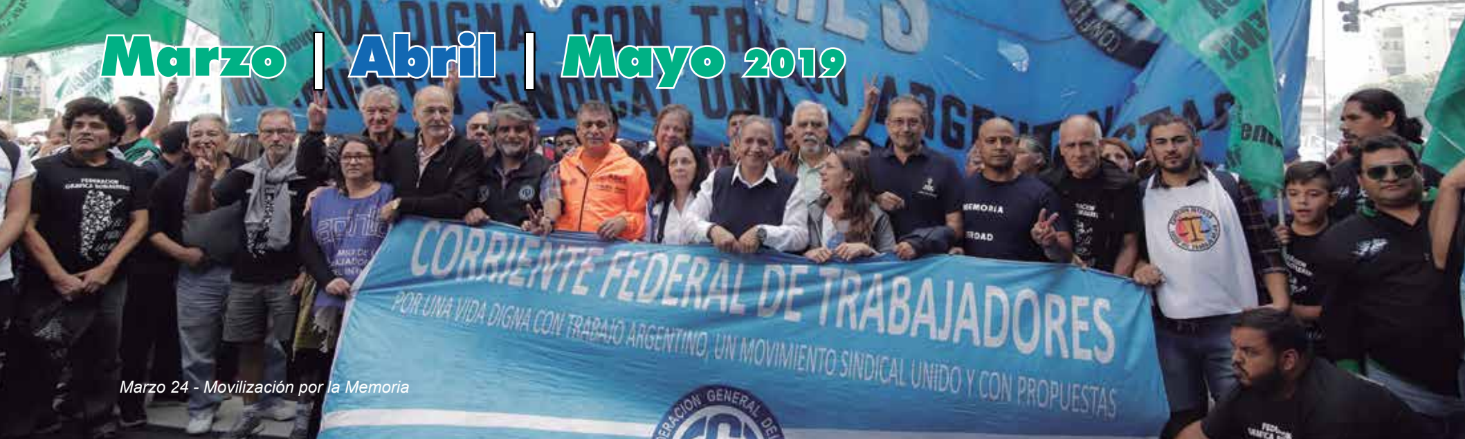
Marzo 24 - Movilización por la Memoria