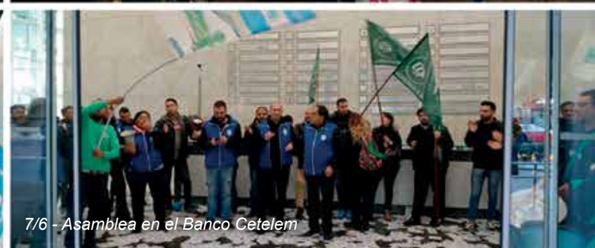
7/6 - Asamblea en el Banco Cetelem