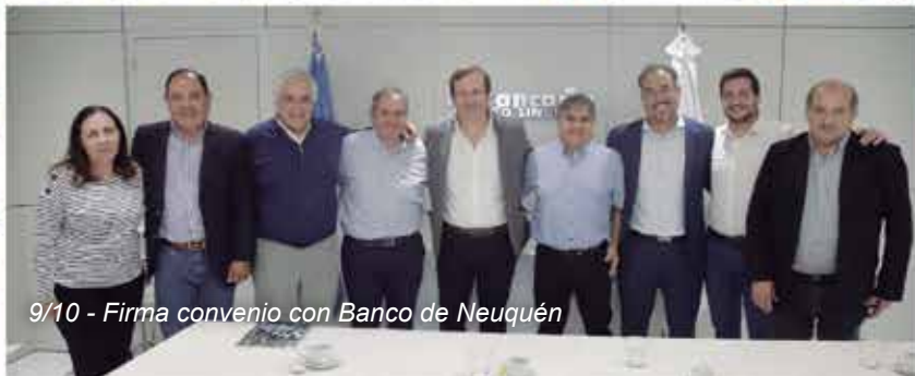
9/10 - Firma convenio con Banco de Neuquén