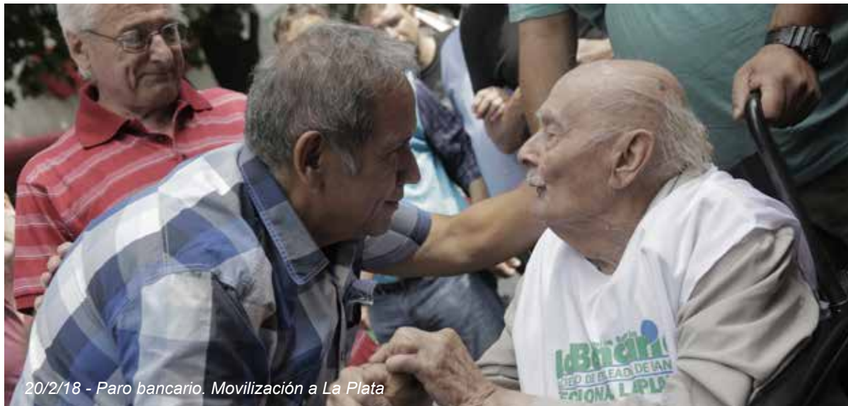
20/2/18 - Paro bancario. Movilización a La Plata

El actual gobierno heredó una crisis sin precedentes, ya que el gobierno encabezado por Mauricio Macri , prácticamente DUPLICÓ todos los indicadores NEGATIVOS : más del 10% de desocupados, 42% de pobres (contra 25%, en 2015), actividad industrial con una capacidad ociosa del 50%, inflación de más del 50%, recesión, desindustrialización, etc. Además de millones de personas con IMPOSIBILIDAD o dificultades para COMER en uno de los principales países PRODUCTORES DE ALIMENTOS, una deuda externa HISTÓRICA e INNECESARIA , por su volumen y por sus condicionalidades, con vencimientos IMPOSIBLES , y que nos somete a CIEN años de dependencia .