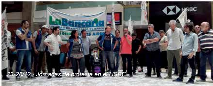
23-26/12 - Jornadas de protesta en el HSBC.