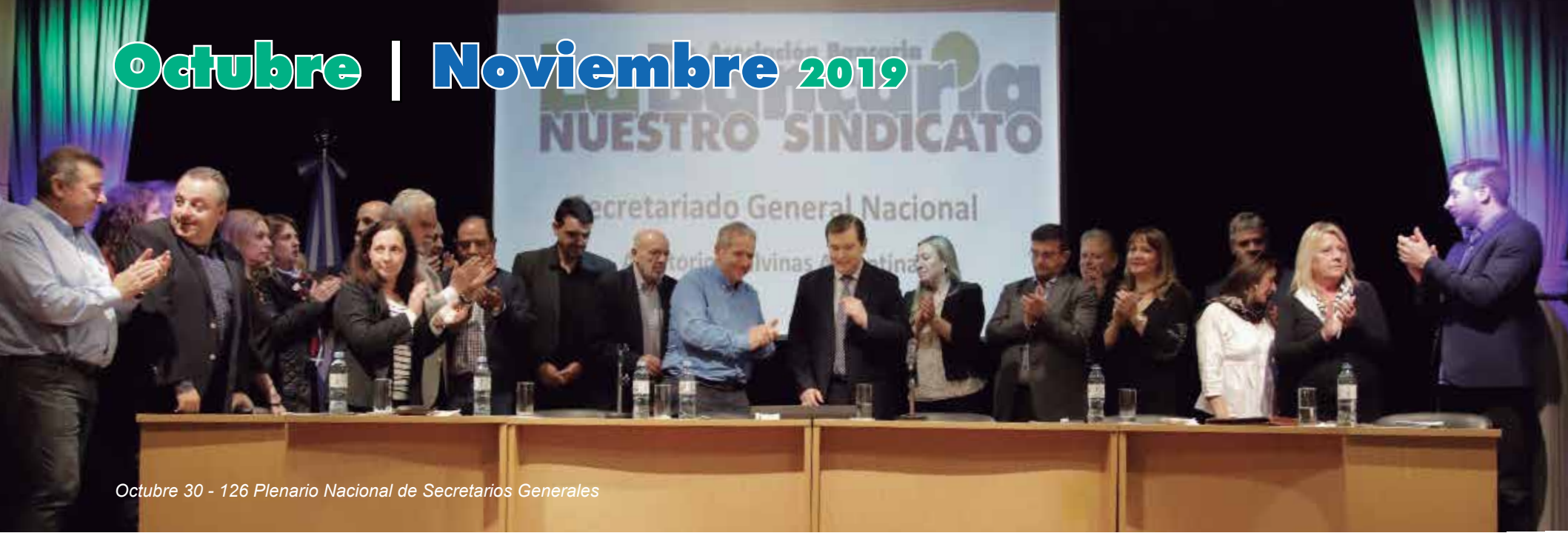
Octubre 30 - 126 Plenario Nacional de Secretarios Generales