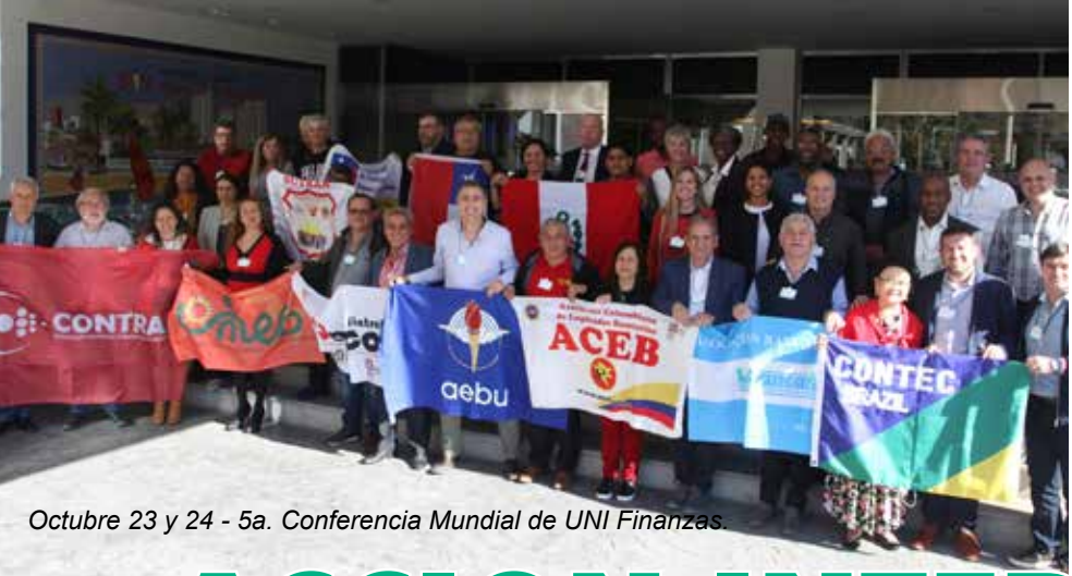
Octubre 23 y 24 - 5a. Conferencia Mundial de UNI Finanzas