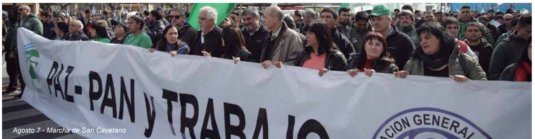
Agosto 7 - Marcha de San Cayetano

Agosto 7 - Estuvimos en la Marcha de San Cayetano convocada por las organizaciones sociales con la adhesión del movimiento sindical, bajo la consigna Paz, Pan, Tierra, Techo y Trabajo. Se insiste en el reclamo de emergencia alimentaria ante los pavorosos datos de indigencia y hambre generados por el esquema económico del Gobierno de la Alianza Cambiemos, del Pro y la UCR.