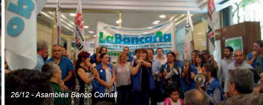
26/12 - Asamblea Banco Comafi