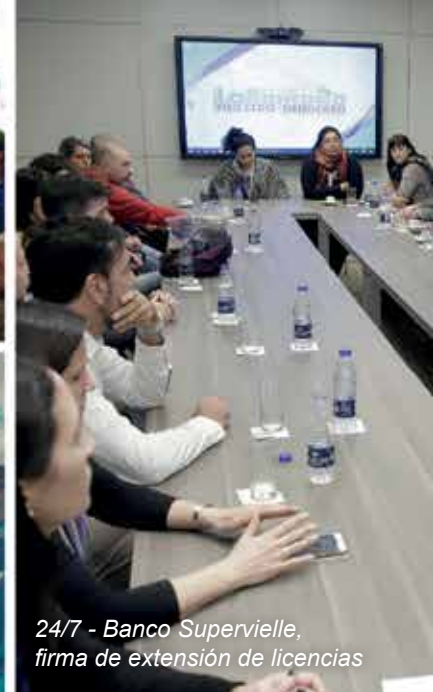
24/7 - Banco Supervielle, firma de extensión de licencias