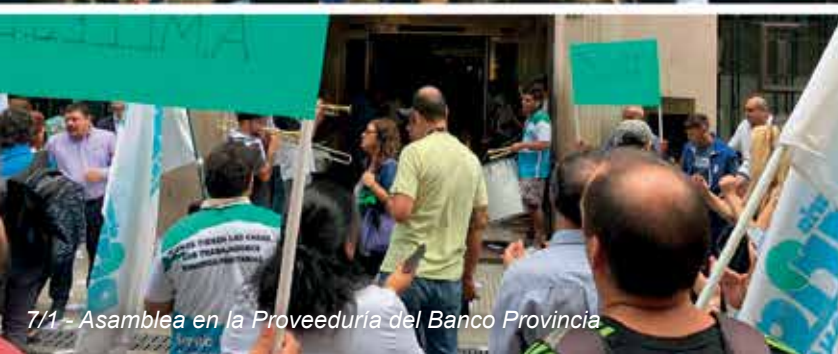
7/1 - Asamblea en la Proveduría del Banco Provincia