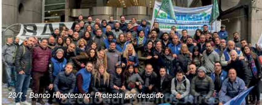
23/7 - Banco Hipotecario. Protesta por despido