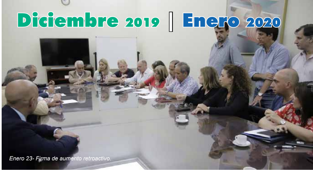
Enero 23- Firma de aumento retroactivo.

pérdida de puestos de trabajo”, y se pronunció por “la necesidad de generar nuevos derechos a partir del cambio político que vivirá en breve la Argentina”.