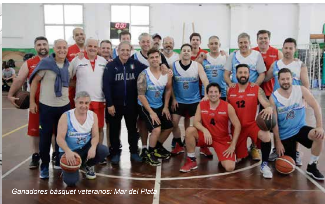
Ganadores básquet veteranos: Mar del Plata