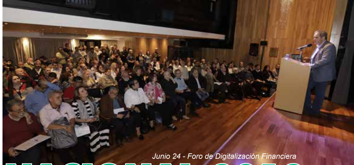
Junio 24 - Foro de Digitalización Financiera