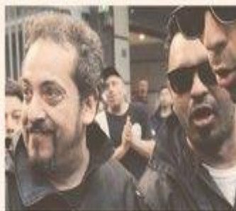
El SUTNA quería su aumento por encima de la inflación

Los sindicatos y las empresas fabricantes de neumáticos se aproximaban anoche a cerrar un acuerdo para resolver el conflicto gremial paritario que lleva cinco meses. ... p. 9