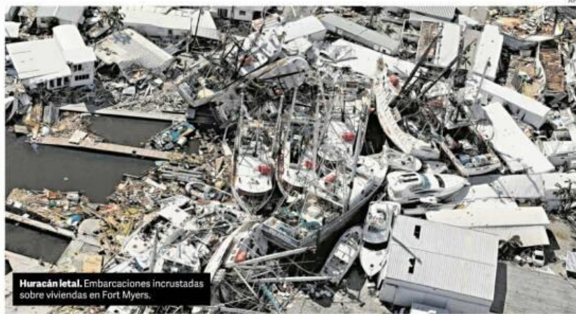
Huracán letal. Embarcaciones incrustadas sobre viviendas en Fort Myers.

El sindicato del PO volvió a rechazar la propuesta de aumento.