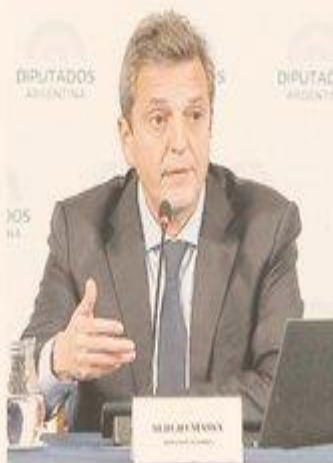
El ministro de Economía, Sergio Massa, quiere los dólares para la producción