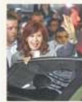
La ex presidenta en el Páramo

Economía cierra el desembolso del FMI PÁG. 3