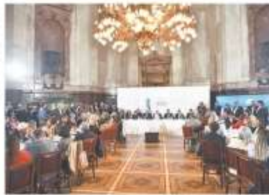
El plenario de combates continuará hoy al debate

Los empresarios manifestaron que la modificación de los aranceles de los bienes industriales que plantea el Régimen de Incentivo para las Grandes Inversiones, incluido en la Ley Bases, genera pérdidas y colapsa al país "en condiciones desfavorables". PÁG. 8