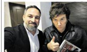
Con Vox. Milei y Santiago Abascal, ayer.

En su segundo día en Madrid, el Presidente desayunó con representantes de empresas españolas con inversiones en la Argentina. En el encuentro hubo pocos directivos de primera línea. El Presidente volvió a reunirse con Santiago Abascal, el líder del partido de derecha Vox. P.14