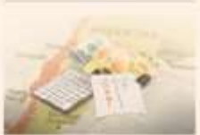
ILUSTRACIÓN FRANCISCO MACIOTTI