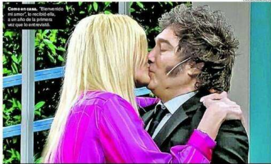
Como en casa. "Bienvenido mi amor", lo recibió ella, a un año de la primera vez que lo entrevistó.

dez también enfrenta otra causa por el escándalo de los seguros, por la cual tendrá que declarar el 20 de este mes, acusado de administración fraudulenta en perjuicio del Estado. P.3