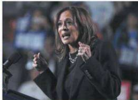
Trump y Harris hicieron campaña ayer en el estado de Pensilvania, el botín más preciado